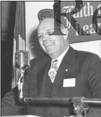
R. G. LeTourneau

El señor LeTorneau creía en esto con todo su ser. Él fue un niño granjero y abandonó la escuela, pero aprendió el oficio de la soldadura y empezó a construir diversos tipos de equipos, en especial vehículos para mover grandes cantidades de tierra y rocas. Sus inventos adquirieron una gran demanda dado que